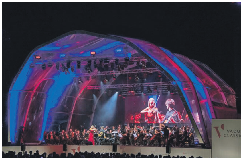
Das Leben geht weiter - und Kultur leistet dazu einen wesentlichen, lebensbejahenden Beitrag und setzt kraftvolle Akzente.

werden und uns allen wieder Freude bereiten kann - so, wie früher.»