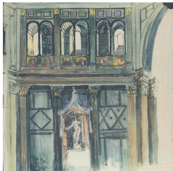
Zeichnungen: Egon Rheinberger (Familienbesitz Rheinberger)

Innenansicht des Florentiner Baptisteriums. Deckfarben über Bleistift.