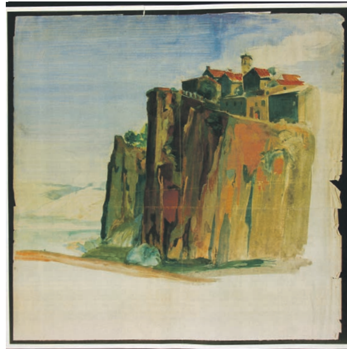
Farbskizze von Orvieto. Farbige Lavierung über Bleistift.